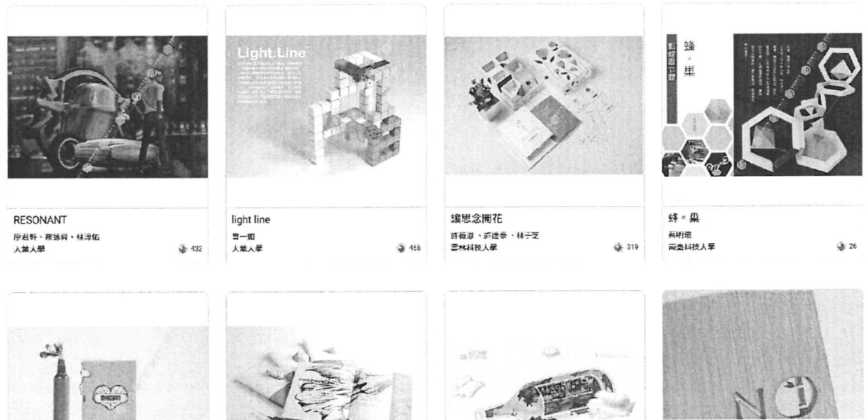
設計師之手數位設計展示平台 展示主頁面