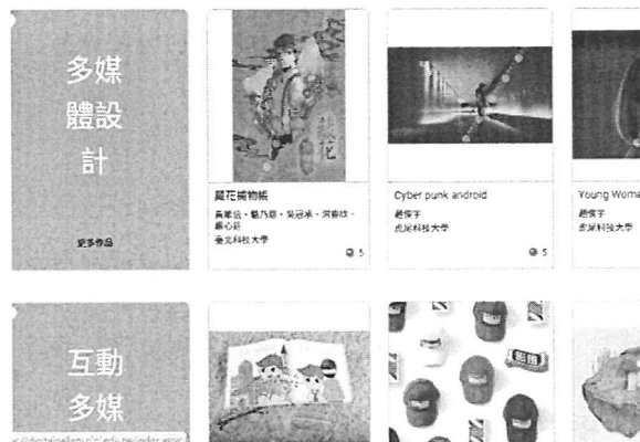
可依各作品類型線上瀏覽